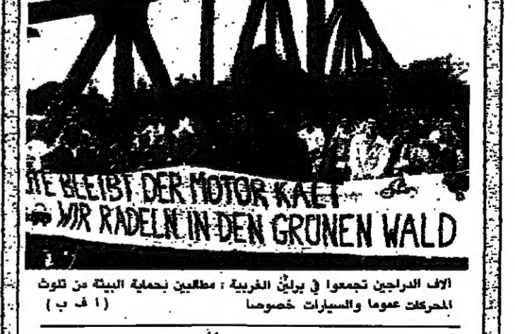
الاف الدراجين تجمعوا في برلين الغربية - مطالبين بحماية البيئة من تلوث المركبات عموماً والسيارات خصوصاً

احتفل الملايين في انحاء العالم بـ يوم الكرة الارضية - لعام ١٩٩٠ في اطار دعوة واسعة النطاق للدفاع عن كوكب الارض الذي تحاصره المخاطر. وتوصل الحدث امس الاول، الذي بدأ كتحية للتعبير عن الوعي بمشاكل البيئة في الجامعات الاميركية عام ١٩٧٠ في الذكرى العشرين له، الى اعلان دولي للاهتمام بمستقبل الطبيعة. وتجمع عشرات الآلاف في مدن في جميع انحاء العالم من تشيكاغو الى سان فرانسيسكو الى طوكيو في المدايق للاستماع الى الموسيقى والغضب. وتوقع منظرو حقل موسيقى ومعرض للبيئة يقام في يومين لهذه المناسبة ان يجذب نحو ٥٠٠٠ شخص الذين هم على ضفة نهر تشارلز، ولكن عدد الحاضرين وصل الى ١٠٠٠٠ شخص. وحضر سياسيون وديبلوماسيون ورجال الاعمال اجتماعاً حاشياً في واشنطن بهدف ان يدعوا على مزيد من التدابير لحماية البيئة.